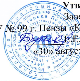
ГРАФИК СМЕНЫ ПОСТЕЛЬНОГО БЕЛЬЯ