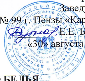
ГРАФИК СМЕНЫ ПОСТЕЛЬНОГО БЕЛЬЯ